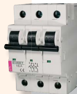
Ogranicznik mocy umownej ETIMAT T